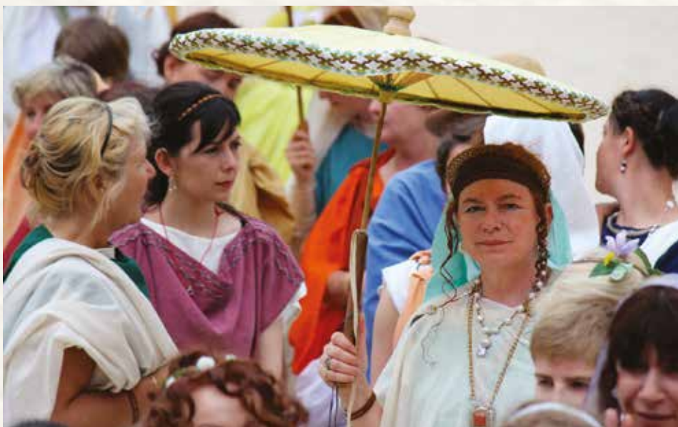
Femmes romaines.